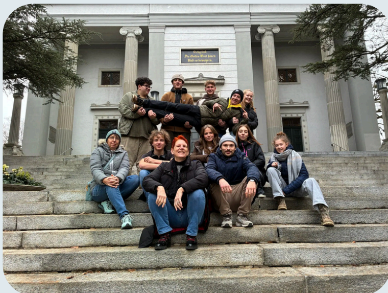
Konflager 2026 mit Churwalden in Zürich