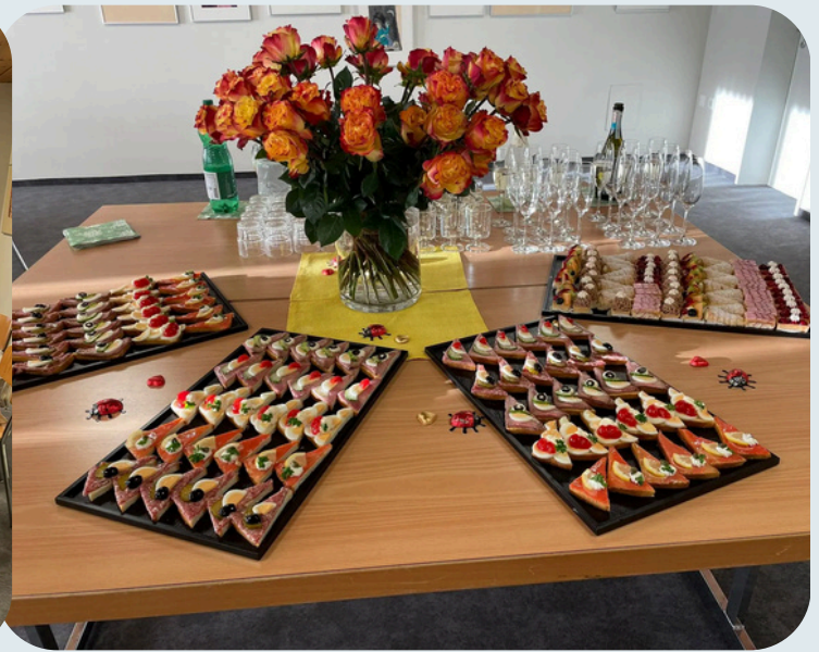
Geburtstagsapéro November 2025