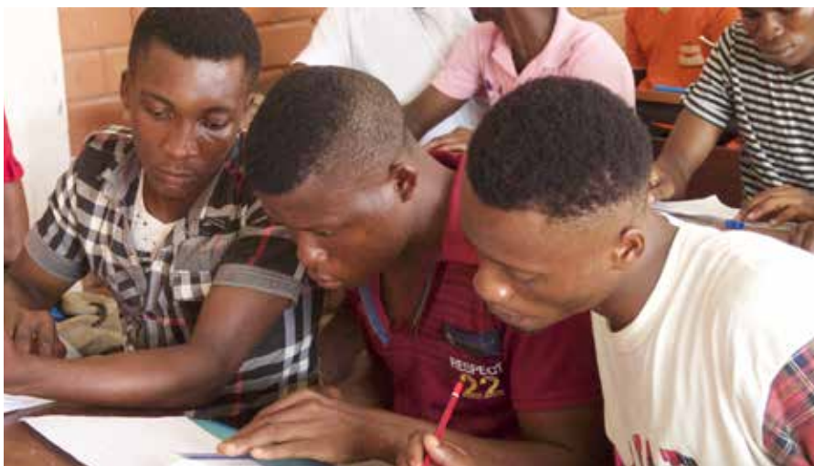
„Non-distance-learning‘ im Präsenzunterricht.

tägliches Einkommen davon abhängt, ob sie ausgehen können oder nicht. Viele von ihnen haben alle Hoffnung verloren. Die Jugendkriminalität steigt, weil Diebstahl, Erpressung Plünderungen und Entführungen zur Geldbeschaffung zunehmen. Nach meinen Beobachtungen in diesen Wochen wird es, wenn die Sperrung fortgesetzt wird, zu einer Hungerepidemie und einer hohen Rate abscheulicher Handlungen kommen. Am 10.04., einige Tage vor der Osterfeier, wurde eine junge Frau, 24 Jahren alt, aus Ohaji Egbema in Imo state vermisst. Nach sieben Tagen wurde sie tot aufgefunden, ermordet und ausgeraubt. Ich weiss, dass die Bundesregierung für unsere Sicherheit arbeitet, aber ich denke, sie sollte zumindest die vielen armen Bürger*innen besonders unterstützen. Danke. Gott segne euch. Verbleibt bitte in Sicherheit.“