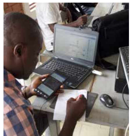
Die IT-Ausstattung der Schule ist dem gesellschaftlichen Durchschnitt weit voraus.

turellen und wirtschaftlichen Herausforderungen verbunden ist: Die Internetverbindungen in Nigeria sind schwach, für Datentransfer entstehen hohe Kosten, die Stromversorgung ist instabil und wir benötigen mehr Generatorenbetrieb. Darüber hinaus können es sich viele Eltern nicht leisten, ihren Kindern Smartphones, Tablets oder Computer inkl. Betriebskosten zur Verfügung zu stellen, damit sie effektiv über das Internet lernen können. Ihnen bleibt im Home-Learning nur das Selbststudium anhand der schriftlichen Ausbildungsunterlagen.“