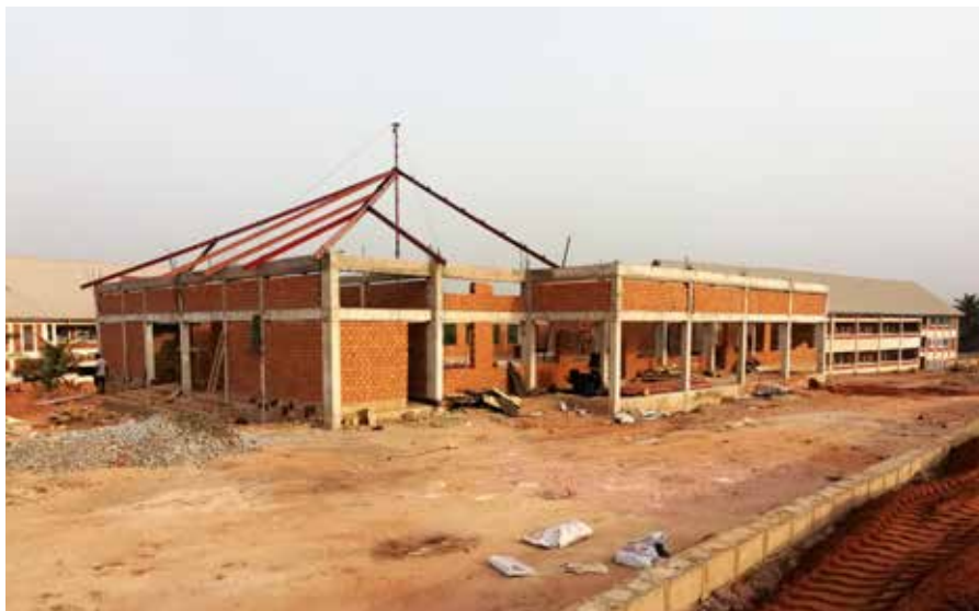
Aula der MOCTECH im Januar 2020.

Für die Baukommission vor Ort, unsere Projektkommission in der Stiftung Tür auf – mo vinavon und unsere deutschen Partner vom Ökumenischen Eine-Welt-Kreis St. Nikolaus Wolbeck e.V. bedeutete das: Zeitplan für den Bau erneuern, Kostenfolgen des Baustopps berechnen, Laufzeitverlängerung des Projektes beim BMZ und Engagement Global in Deutschland beantragen, Zwischennachweis für die Mittelverwendung erstellen. Ergebnisse: Vorausgesetzt, der Lockdown wird auf Mitte Mai gelockert, sollte bis Ende Juni der Bau fertig gestellt sein können. Die Kostenfolgen des Baustopps bewegen sich in den Grenzen des Baubudgets, wie die Zwischenabrechnung Ende April zeigte. Wer von den Arbeitskräften in eine ernste finanzielle Notlage gerät wird von der MOF unterstützt. Und unser Verlängerungsantrag für die Projektlaufzeit bei Engagement Global wurde speiditiv genehmigt. Wir alle sind froh, dass der Lockdown für unser Projekt glimpflich ausgeht und keine schwerwiegenden Folgen hat.