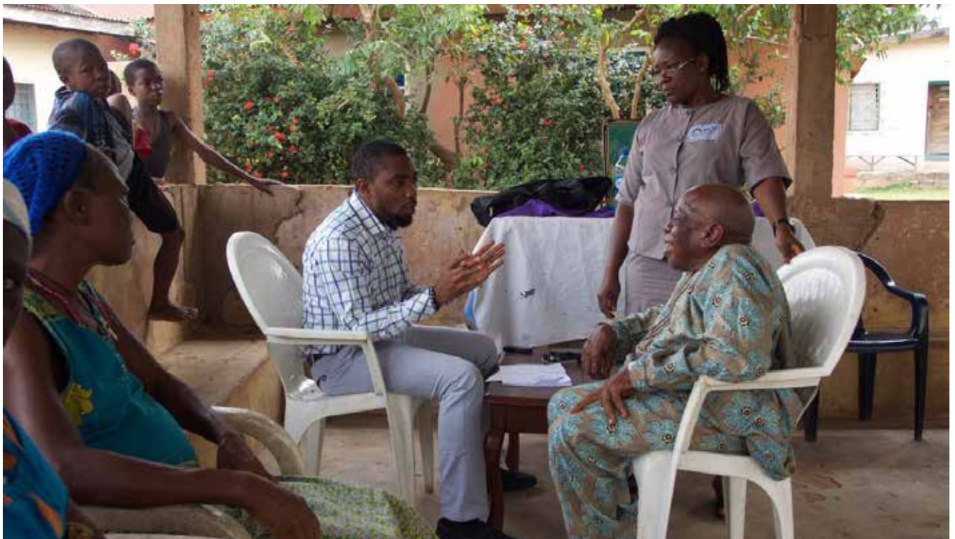
Spitex-Arztvisite zu Hause bei den Patienten.