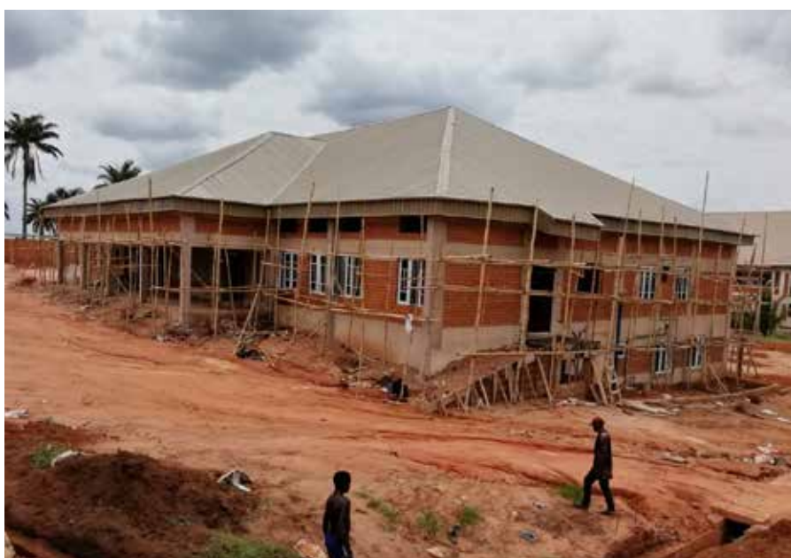
Aula der MOCTECH zum Baustopp im März 2020.

Auch die Planungen für das kommende Landwirtschaftsprojekt Songhai mussten wir stoppen. Im Januar 20 hatten die Bäuerinnen der Genossenschaft mit Stolz verkündet, dass sie die notwendigen 3,5 ha Land für Tierfarm und Gemüseanbau zusammen haben. In vielen Gesprächen mit den Eigentümerfamilien waren Überzeugungsarbeit geleistet und Verkaufszusagen eingeholt worden. Ende Januar wurde der Songhai-Zentrale in Benin der Auftrag zur Erstellung des Gesamtprojektes erteilt. Ihre Fachleute kamen nach