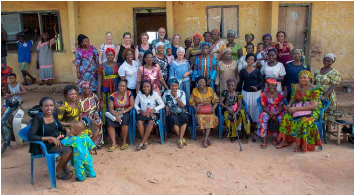
Auf der Projektreise 2019 begann mit den Genossenschaftsfrauen die Planung von Songhai.

BMZ wird wahrscheinlich 2021 möglich sein, so dass erst 2022 alles fertig ist. Zum Glück ist aufgeschoben nicht aufgehoben, und auch wenn die Verzögerung viele Bäuerinnen enttäuscht, ihre Begeisterung für die Arbeit an der Songhaifarm lassen sie sich nicht nehmen.