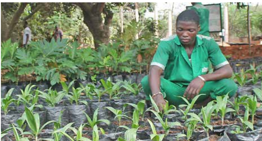
Songhai in Benin ist ein Modellprojekt für eine afrikanischen Voraussetzungen und Traditionen angepasste integrierte und biologische Farmwirtschaft.

Auch die Planungen für das kommende Landwirtschaftsprojekt Songhai mussten wir stoppen. Im Januar 20 hatten die Bäuerinnen der Genossenschaft mit Stolz verkündet, dass sie die notwendigen 3,5 ha Land für Tierfarm und Gemüseanbau zusammen haben. In vielen Gesprächen mit den Eigentümerfamilien waren Überzeugungsarbeit geleistet und Verkaufszusagen eingeholt worden. Ende Januar wurde der Songhai-Zentrale in Benin der Auftrag zur Erstellung des Gesamtprojektes erteilt. Ihre Fachleute kamen nach