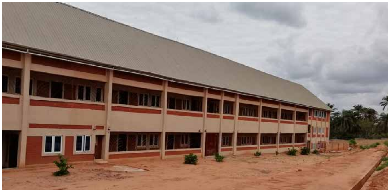
Studentenwohnheim der MOCTECH im März 2020.